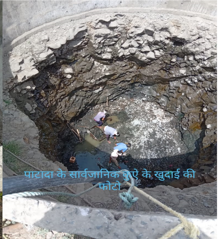
पाटादा के सार्वजनिक कुएे के खुदाई की फोटो